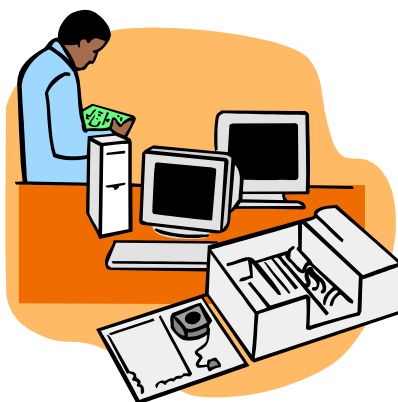
Slika 1: Ime slike

(vir: Naslov slike/tabele. [Citirano datum; ura]. Dostopno na spletnem naslovu: <http:// ...>)